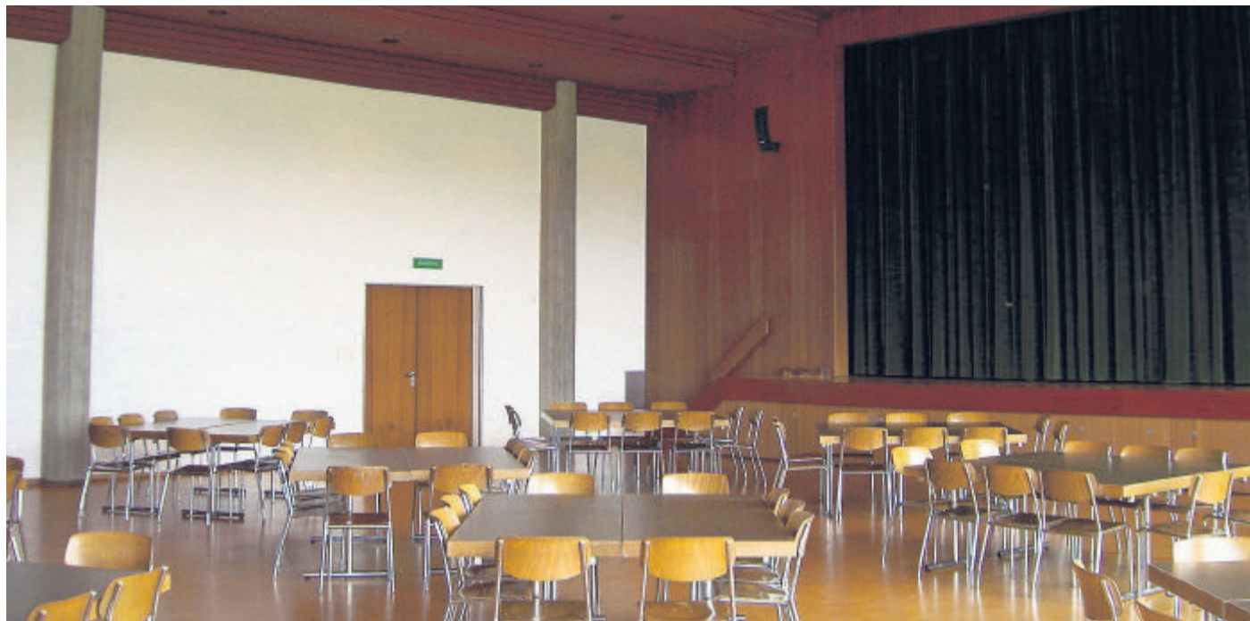
Der 30jährige Buchensaal in Speicher soll saniert werden. Der Gemeinderat hat einen Projektierungskredit bewilligt.